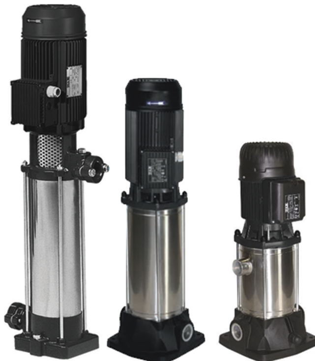
سانتریفیوژ های عمودی با روکش رنگ جدید کاتافوریس

پمپ های جدید از تاریخ ۲۵ ژانویه ۲۰۱۶ تولید شده و پس از اتمام فروش مدل های قدیمی به بازار عرضه خواهند شد. بارکد و قیمت آنها بدون تغییر باقی میماند. کاتالوگ فنی پمپ های جدید به همراه جزئیات بیشتر در مورد مزایای استفاده از رنگ کاتافوریس به صورت فایل Power point موجود میباشد .